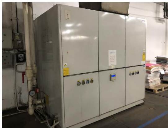
水冷式空調空裝《溫度平衡技術》