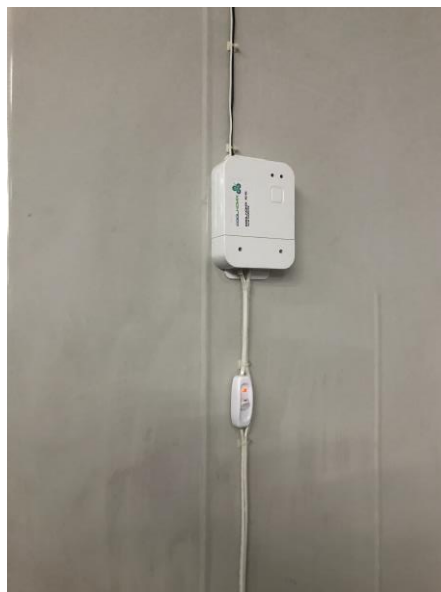
製冷溫度平衡系統